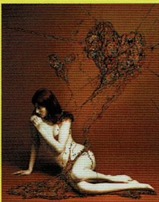
1:草間彌生《かぼちゃ》1990 アクリル絵具、キャンバス © YAYOI KUSAMA 2:志賀理江子《千愛子》「CANARY」シリーズより 2007 タイプCプリント Courtesy of the artist 3:小沢剛《ベジタブル・ウェポン—アイランドのグラフィックス(生鮭の岩塩・ハーブ漬け)/ニューヨーク》2002 ラムダプリント © Tsuyoshi Ozawa 4:加藤泉《無題》2007 油彩、キャンバス Courtesy of the artist 5:村山留里子《無題(RB02)》2004 ミクストメディア、ビスチェ(10点組) © Ruriko MURAYAMA, courtesy of YAMAMOTO GENDAI 6:奈良美智《Green Mountain》2003 アクリル絵具、色鉛筆、紙 © Yoshitomo Nara, courtesy of the artist 7:天明屋尚《ネオ千手観音》2002 アクリル絵具、木、ブラックジェッソ © TENMYOUYA Hisashi, courtesy of Mizuma Art Gallery 8:清川あさみ《Complex-heart》2008 写真、ビーズ、刺繍糸 © asamikiyokawa