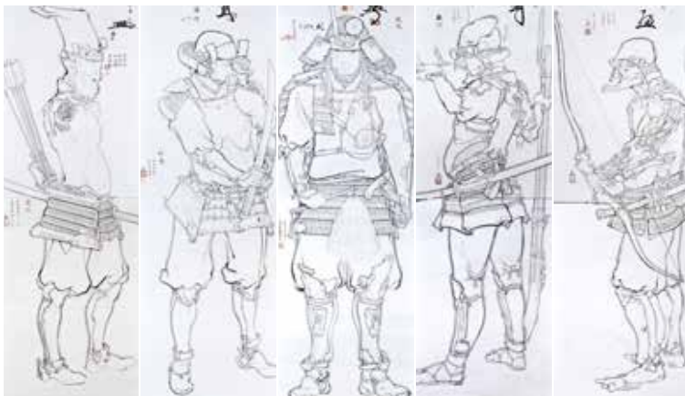
山口晃《五武人圖》 2003年、高橋龍太郎コレクション蔵

奈良時代(8世紀)、大田区蔵(東京国立博物館寄託)