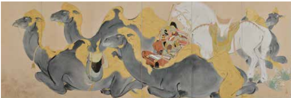
川端龍子《源義経(ジンギスカン)》 1938年、大田区立龍子記念館蔵

©YAMAGUCHI Akira, Courtesy of Mizuma Art Gallery