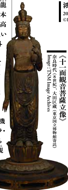
《十一面観音菩薩立像》

奈良時代(8世紀)、大田区蔵(東京国立博物館寄託)