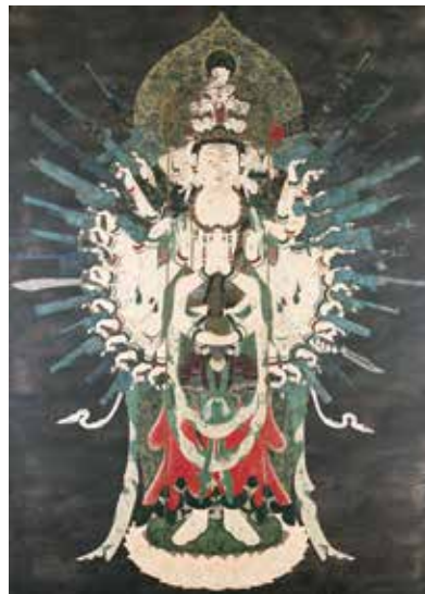
天明屋尚《ネオ千手観音》